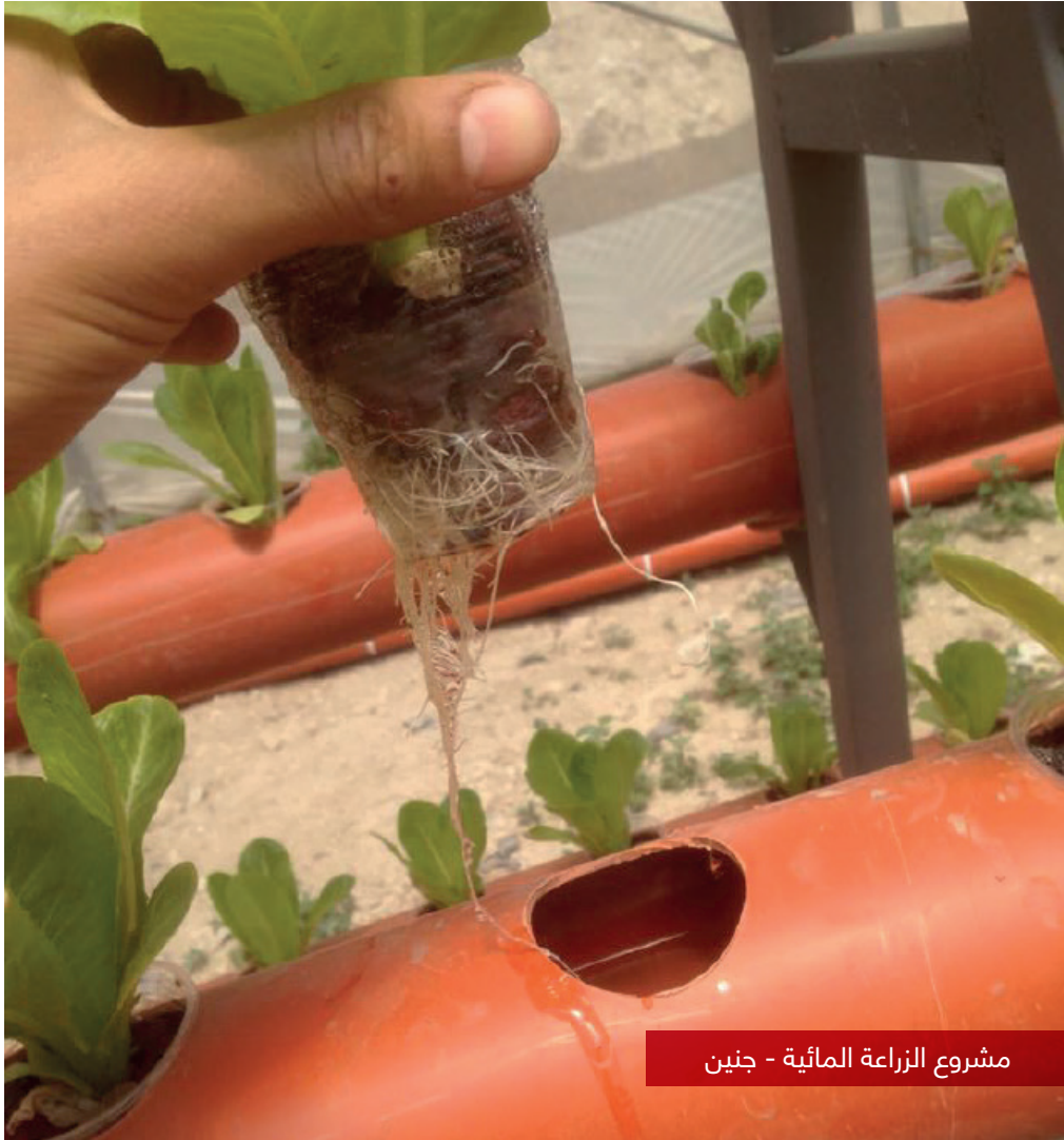
مشروع الزراعة المائية - جنين

لقد تم بناء الخطة الاستراتيجية لتستجيب للاطار المؤسسي العام ولتتماشى مع الادارة المبنية على البرامج، وذلك من خلال مراحل العمل لتحديد الوجهات الاستراتيجية وبناء الخطة التنفيذية للبرامج والدوائر والوحدات والفروع وتحديد مؤشرات الأداء لكل منها وذلك ضمن الموازنات المعتمدة. والشكل التالي يظهر الاطار العام للمؤسسة (رؤية، رسالة، وقيم، وهدف استراتيجي)، والوجهات الاستراتيجية للخطة الاستراتيجية 2017-2019.