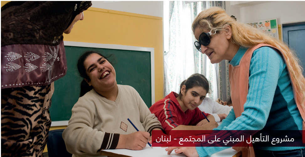
مشروع التأهيل المبني على المجتمع - لبنان