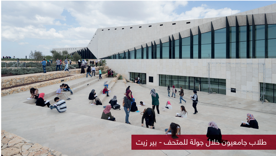
طلاب جامعيون خلال جولة للمتحف - بير زيت