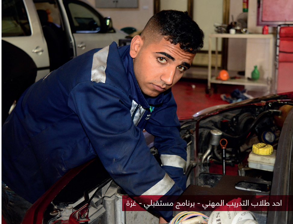
احد طلاب التدريب المهني - برنامج مستقبلي - غزة