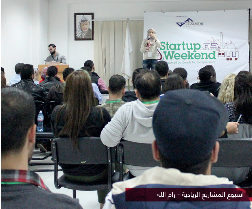
اسبوع المشاريع الريادية - رام الله