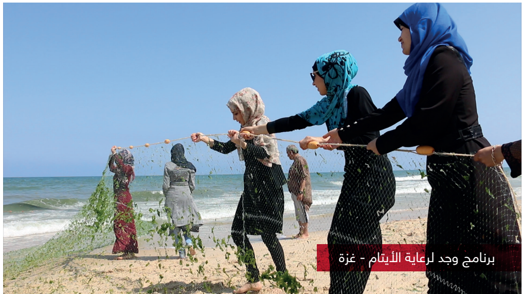
برنامج وجد لرعاية الأيتام - غزة

وتأتي هذه الخطة ثمرة جهود مؤسساتية بدأت بمراجعة أداء عمل المؤسسة خلال السنوات الماضية ومن ثم تحليل دورها المستقبلي، تبع ذلك تحليل البيئة السياسية والاجتماعية والاقتصادية والثقافية المحيطة بالمؤسسة في مناطق عملها المتعددة، وتحديد المخاطر ووضع السيناريوهات المتوقعة خلال الفترة القادمة، ومن ثم وضع التصور العام للتدخلات استناداً الى بعض مؤشرات التنمية المستدامة 2030 ومبادئ حقوق الانسان وذلك ضمن منحنى الادارة المبنية على البرامج. وقد توزعت التدخلات المقترحة للمؤسسة ضمن سبعة برامج رئيسية وبموازنة كلية مقدارها 141 مليون دولار أمريكي.